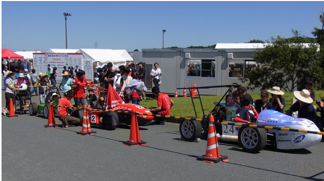
ゲートオープン待ち、気持ちががはやります。