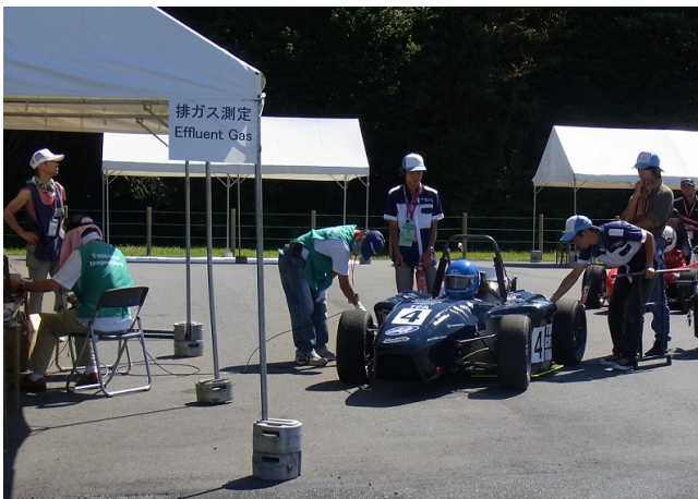
レーシングマシンといっても、環境対策は重要です。写真は排ガステストですが、他にも騒音テストも重要です。