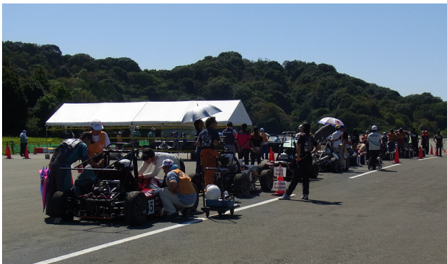
コースイン待ちの列が伸びます。