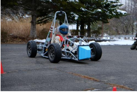
今年度最速シェイクダウン