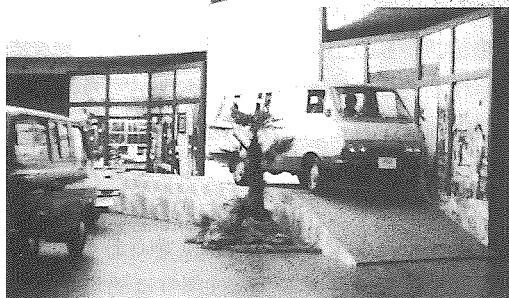
デザインドームでのハイエース内示会