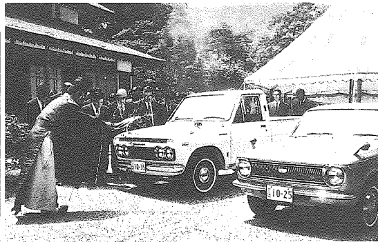
伊勢神宮でハイラックスとカロラの前で(その1)