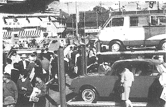
日比谷公園での最初の自動車ショー