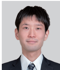
講演番号：112 実走行データを用いた自動運転用リーンド地図更新システムの提案