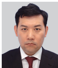
講演番号：141 直噴ガソリンエンジンのPN低減技術の研究(第1報)-Tip-sootの発生メカニズムとそのキーパラメータ-