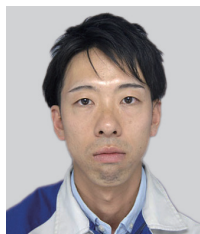
講演番号：222 前面衝突性能に対するロバスト設計技術の構築と開発適用事例