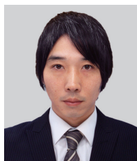
講演番号：260 トランスミッションにおける歯元歪の予測手法