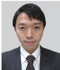
講演番号：079 CVT ベルトノイズ発生源視える化によるメカニズム解析

今回は，下記8名の方々が受賞されました。授賞式は，2018年春季大会会期中の5月24日にパシフィコ横浜にて開催されます。