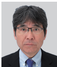
講演番号：185 交通事故パターンを活用した事故データ分析手法の検討