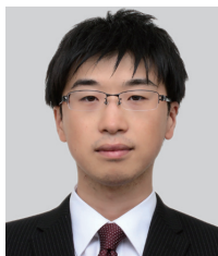
講演番号：132 冷間鍛造部品製造において焼鈍と焼準を同時に省略可能とする浸炭用棒鋼線材