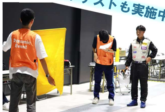
掲示される旗の意味をテストします。