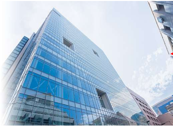
タワースコラ 1階 S101教室

JR中央・総武線「御茶ノ水」駅下車徒歩3分 東京メトロ千代田線「新御茶ノ水」駅下車徒歩3分 東京メトロ丸ノ内線「御茶ノ水」駅下車徒歩5分