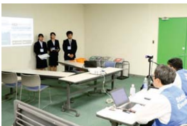
ビジネスモデルのプレゼン